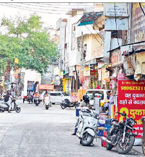
दुकानदारों और स्थायी लोगों ने किया स्वागत