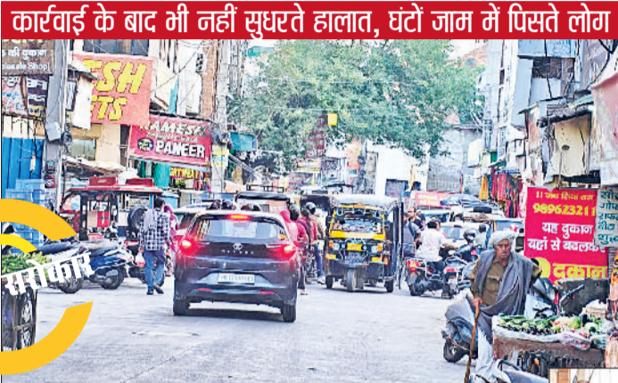
कार्रवाई के बाद भी नहीं सुधरते हालात, घंटों जाम में पिसते लोग

शहर के व्यस्त दुर्गा भवन मंदिर से माल गोदाम रोड तक इन दिनों जाम और अतिक्रमण ने लोगों की जिंदगी मुश्किल बना दी है। कागजों में करीब 50 फुट चौड़ी यह सड़क हकीकत में महज 10 फुट तक सिमट गई है। सड़क किनारे खड़े वाहन, दुकानों के बाहर फैला सामान और रेहड़ियां ट्रैफिक को पूरी तरह बाधित कर रही हैं। हालात यह हैं कि सुबह-शाम के समय लोग घंटों जाम में फंसे रहते हैं। भीषण गर्मी में यह परेशानी और बढ़ जाती है, जब धूप में खड़े वाहन चालकों और राहगीरों को भारी दिक्कतों का सामना करना पड़ता है। सबसे चिंताजनक स्थिति तब होती है जब एंबुलेंस और इमरजेंसी वाहन भी इस जाम में फंस जाते हैं। प्रशासन द्वारा समय-समय पर कार्रवाई के बावजूद स्थायी समाधान नहीं निकल पाया है, जिससे लोगों में नाराजगी बढ़ रही है।