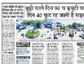
हरिभूमि न्यूज़ | रोहतक

जागरूकता के साथ सख्ती नियम तोड़ने वालों पर लगातार कार्रवाई के संकेत